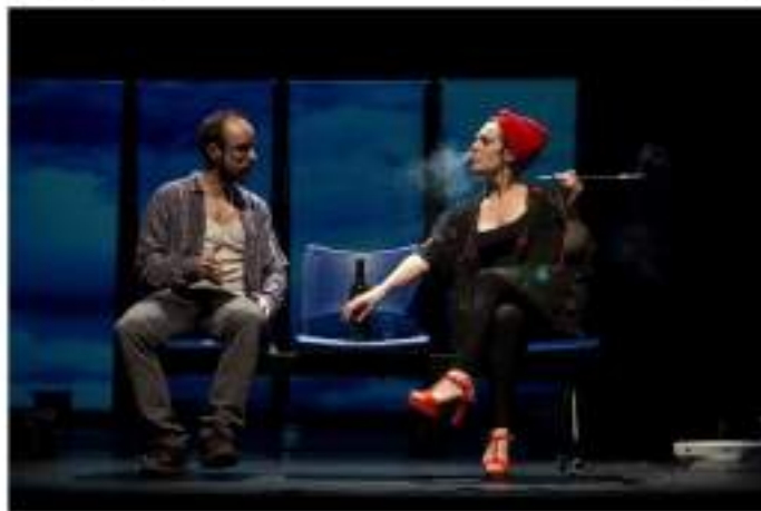
Fuera de juego.